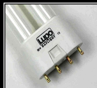
Lámparas especiales LUPO de 9 fósforos