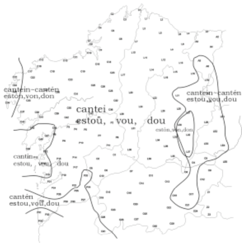
Mapa 2: Engádega de -n no sufixo número-persoal da P1 dos verbos rematados en ditongo