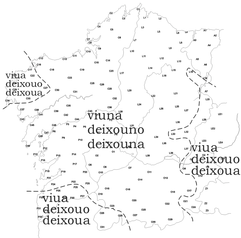
Mapa 1: Pronome átono acusativo de P3 tras formas verbais rematadas en ditongo